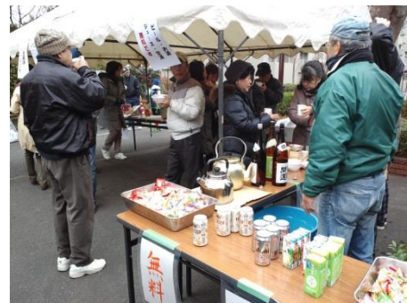
お茶やジュースも無料提供

クライマックスは大抽選会。ギフト券・お米・石鹼・入浴剤 あれこれ、当選した方に手渡されます。末等にも掛からなかった方へは参加賞の「保湿ティッシュ」。それぞれが帰路についてほどなく、空からポツリ… ポツリ、ポツッ、ポツポツポツ。「あや〜、よかったね」