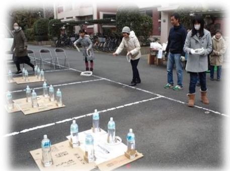
輪投げの的はペットボトル