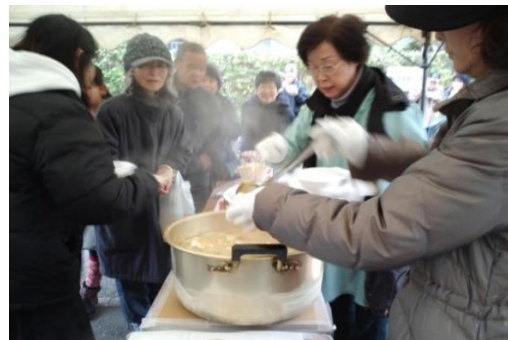
具たくさんアツアツのトン汁