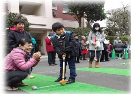
はじめての…グランドゴルフ