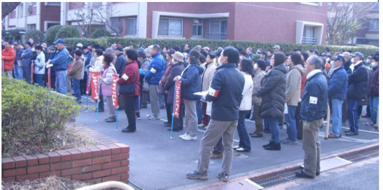
プレイロットに集合して説明を聞く参加者たち