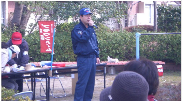
金沢消防署 幸浦出張所 奥上所長 あいさつ