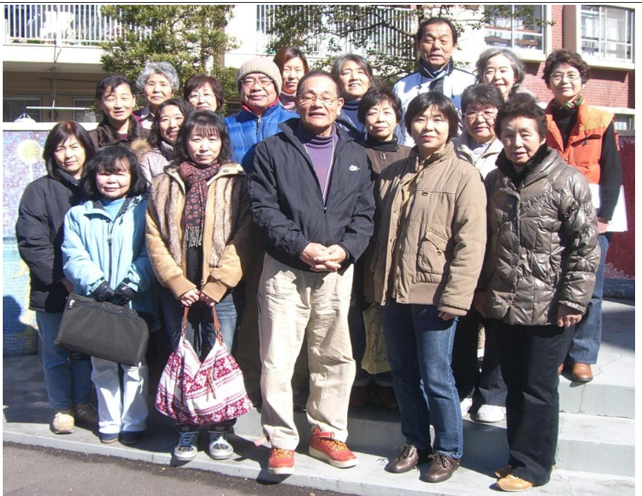
第33期（平成22年度）自治会役員

34期(23年度)の役員さん どうぞよろしくお願ひしま す。そしてブラウンの皆 さん22年度同様どうぞ 協力お願ひ申し上げます。