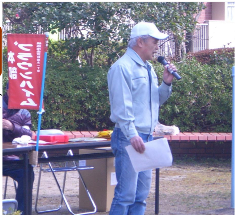
稲村会長 あいさつ