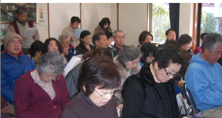
2月13日 事前打ち合わせ