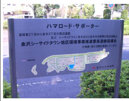
ハマロードチューリップ こんなにきれいに咲きました