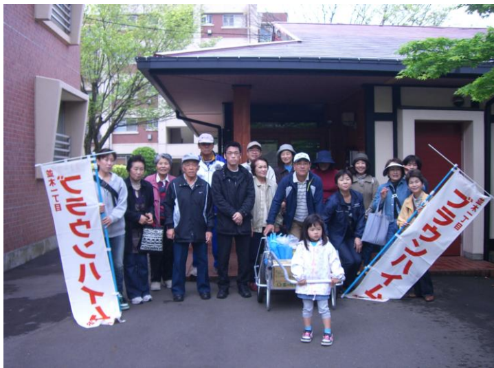
応援もがんばってねー