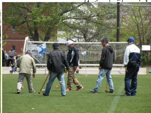
スコアはどう？ そりゃあボールに聞いてくれ