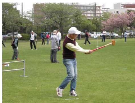
ん？ いけそ～ かな？