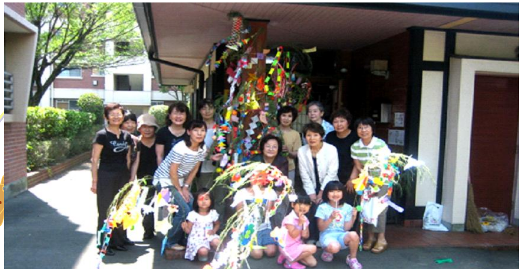
さつき会の皆さんと応援の方々・子供さんとお母さん達